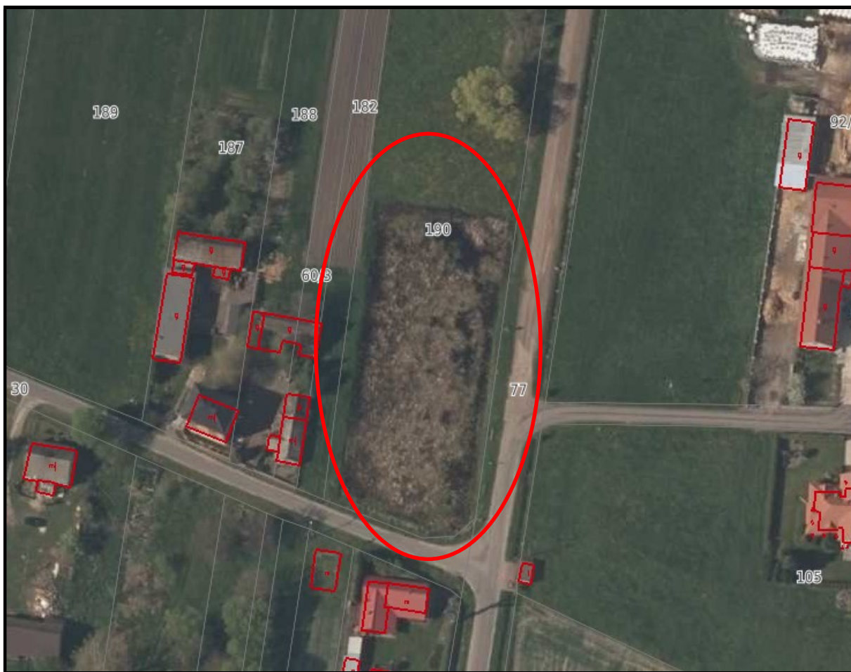
Ryc. 1. Zbiornik wodny.

Inwestycja nie wymaga uzyskania decyzji o środowiskowych uwarunkowaniach. Zgodnie z rozporządzeniem Rady Ministrów z dnia 10 września 2019 r. w sprawie przedsięwzięć mogących znacząco oddziaływać na środowisko budowa zbiornika o powierzchni mniejszej od 0,5 ha nie należą do przedsięwzięć mogących potencjalnie znacząco oddziaływać na środowisko i mogą wymagać uzyskania decyzji środowiskowej.